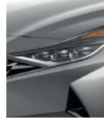
Metal fluido (M6T)