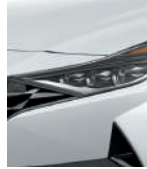
Blanco polar (WAW)