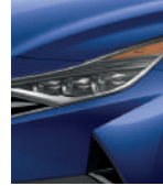
Azul intenso (YP5)